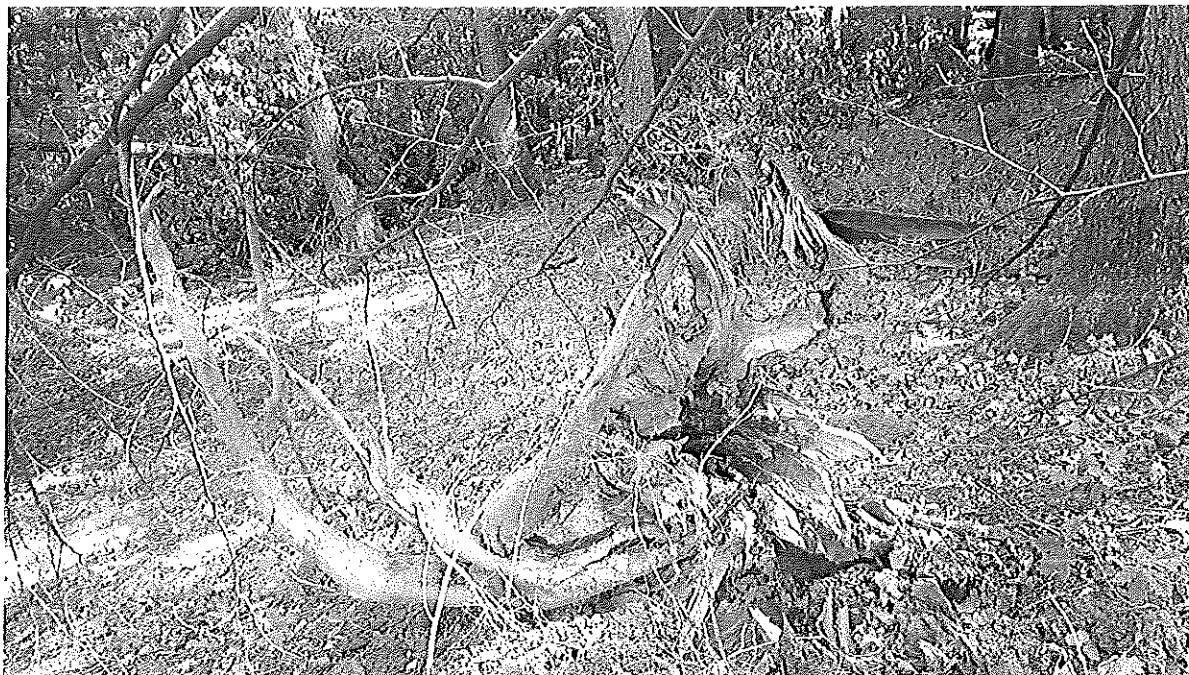
UPII, ua 53E%, S=2,0 ha, pădure proprietate de Stat, 07.07.2017