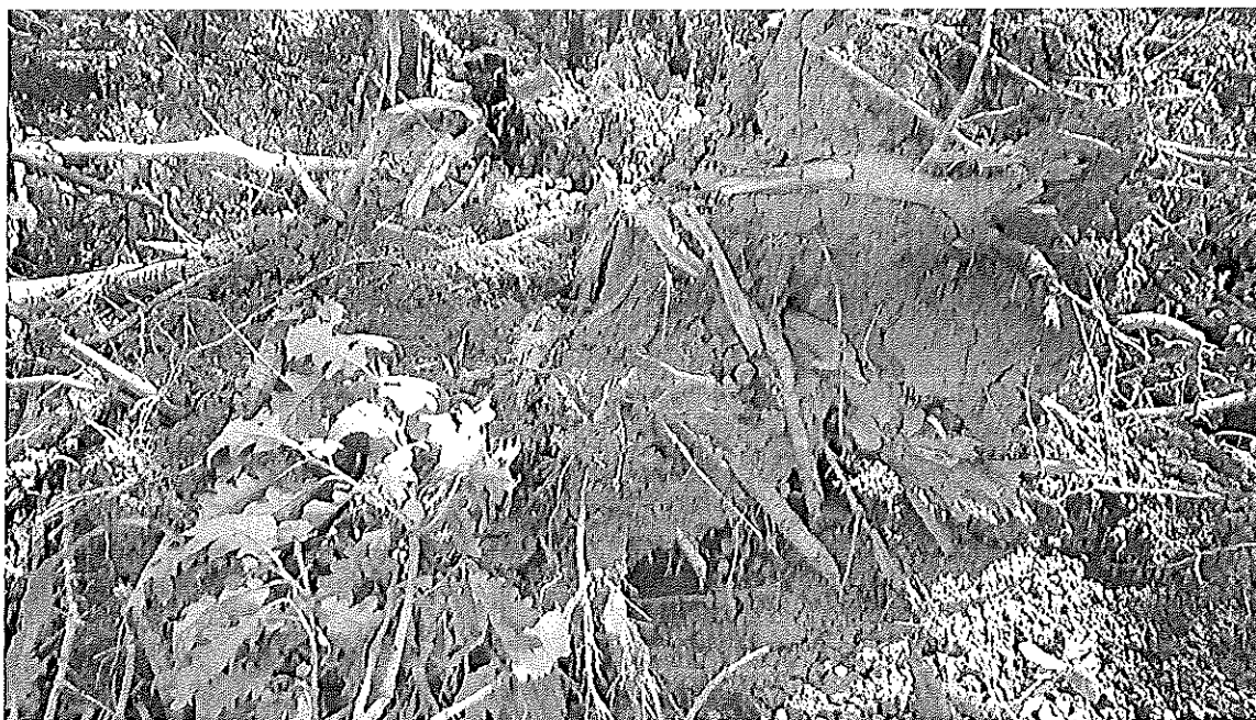
UPII, ua 53E%, S=2,0 ha, pădure proprietate de Stat, 07.07.2017